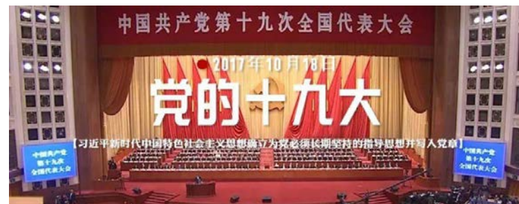
中国共产党第十九次全国代表大会 2017年10月18日 党的十九大 【习近平新时代中国特色社会主义思想确立为党必须长期坚持的指导思想并写入党章】