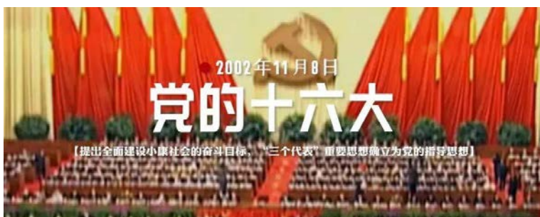
2002年11月8日 党的十六大 【提出全面建设小康社会的奋斗目标，“三个代表”重要思想确立为党的指导思想】