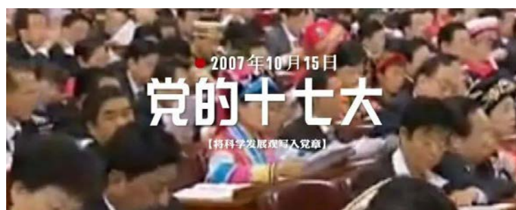
2007年10月15日 党的十七大 【将科学发展观写入党章】