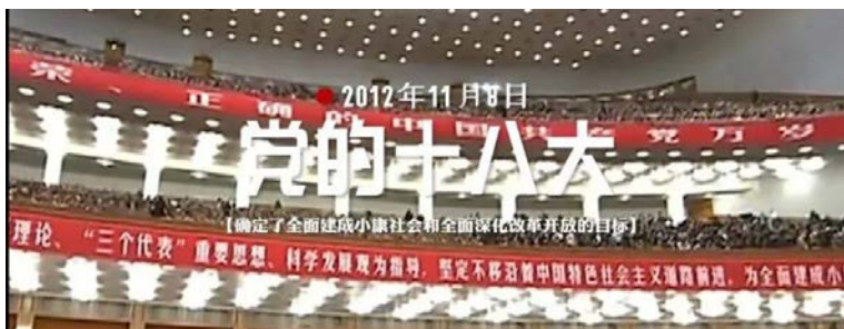
2012年11月8日 党的十八大 【确定了全面建成小康社会和全面深化改革的目标】